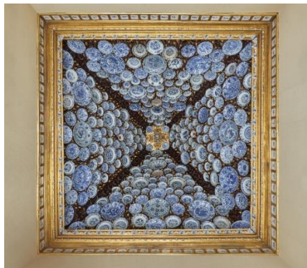
Palais Santos

Nous reviendrons à Lisbonne pour visiter le palais de Santos résidence officielle de l'Ambassadeur de France au Portugal, dont l'histoire remonte au XII ème siècle.