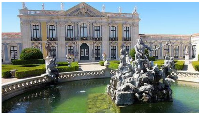
Figure 1 Palais Queluz

cours du règne de Joseph I er , lorsque le Portugal était en fait gouverné par le favori , le marquis de Pombal .