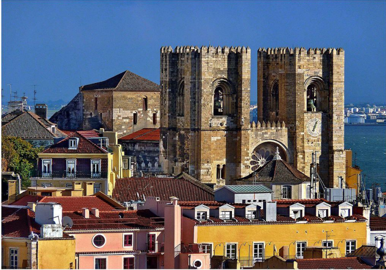
Cathédrale de Sé