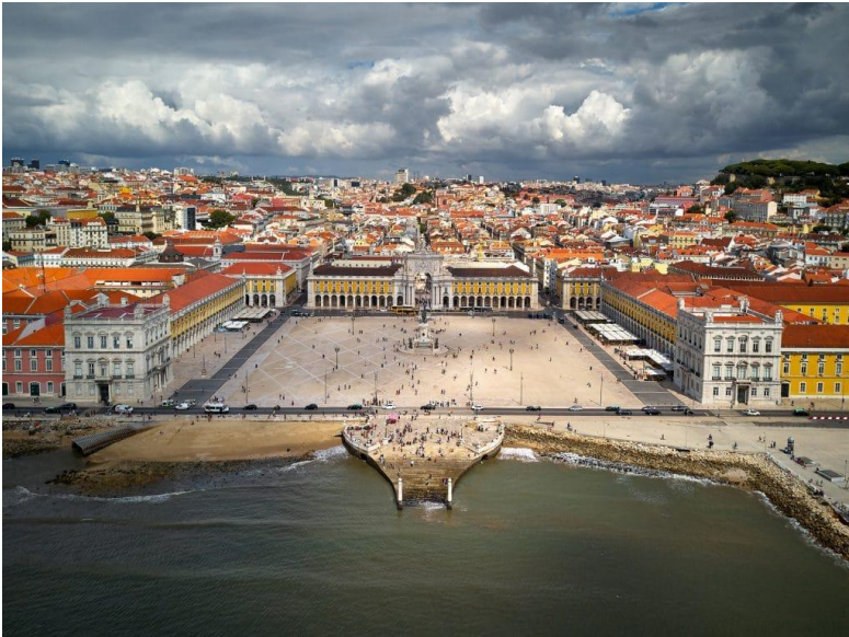
Place du Commerce

Belvédère Sao Pedro de Alcantara dans le Bairro alto, puis sur la place du Rossio. On continue par l'ascenseur de Santa Justa, le quartier du Chiado avec A Brasileira café art nouveau, par la rue Augusta avec ses anciens magasins dans la Baixa. On peut s'accorder une pause sur la place du Commerce dans le plus vieux café littéraire de Lisbonne, ouvert en 1782 et fréquenté par Pessoa, le café Martinho da Arcada. C'est une des plus belles places d'Europe ouvrant sur le Tage par un embarcadère où épices et trésors des colonies étaient déchargés.