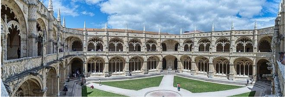
Monastère des Hiéronymites

Gama, et Fernando Pessoa. La dégustation d'un Pastel de Belém s'impose avant de poursuivre.