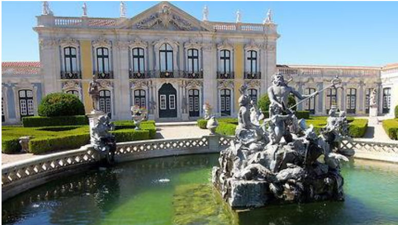
Figure 1 Palais Queluz

cours du règne de Joseph I er , lorsque le Portugal était en fait gouverné par le favori , le marquis de Pombal .