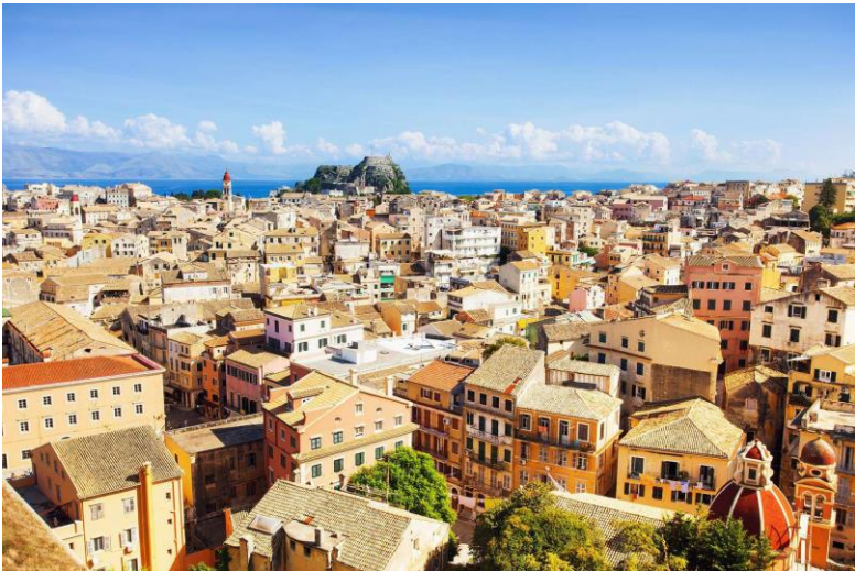
Les bâtiments et maisons qui constituent la vieille ville

Située à l'entrée de la mer Adriatique, la vieille ville de Corfou occupe une position stratégique. Ses fortifications ont longtemps servi à défendre les intérêts du commerce maritime de la République de Venise contre l'Empire Ottoman.