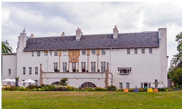
Maison d'amateur d'art, parc Bellahouston

Nous nous rendrons au cœur du parc Bellahouston pour découvrir l'élégante maison d'un amateur d'art. Conçue pour la retraite d'une personne de goût et de culture, son but aujourd'hui est de stimuler l'intérêt du public pour l'art, le design et l'architecture.