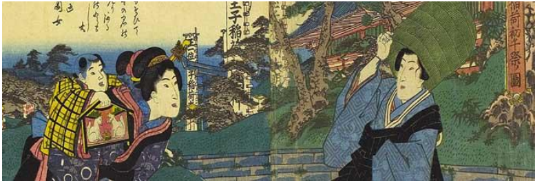
Détail de "Fête du Premier Jour du Cheval au sanctuaire d'Oji Inari, Utagawa Toyokuni. Colour woodblock print, 1847-52