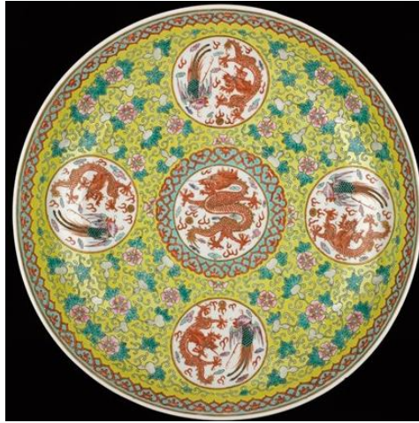
Plat circulaire en porcelaine, Chine, dynastie Qing, Qianlong règne, 1736-1795 AD

Edimbourg, où les collections asiatiques du musée national nous laisseront pantois.