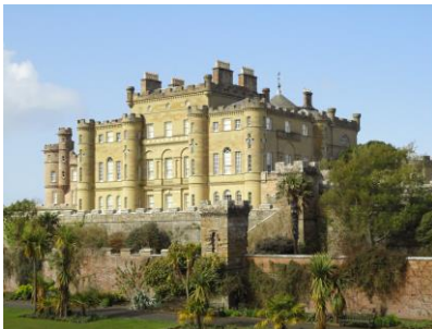
Château de Culzean

A nous le château de Culzean, sur lequel l'architecte Robert Adam a laissé son empreinte au XVIII ème s. Dominant une falaise au bord de la mer, il abrite un jardin