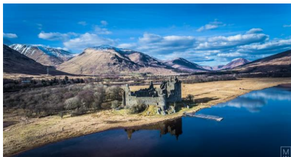
Vue aérienne du Loch Lomond

Un séjour en Ecosse sans se laisser pénétrer par l'ambiance d'un loch est impensable. Nous atteindrons par la route le loch Lomond, le deuxième plus important de Grande Bretagne par sa surface, situé au sud des Highlands. En 2005, un sondage auprès des lecteurs du magazine britannique Radio Times , le plaçait à la sixième place des plus belles merveilles naturelles de Grande-Bretagne.