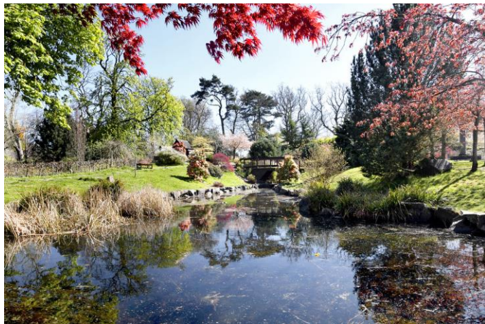
Kyoto Garden de Takashi Sawano

l'auteur d'un ouvrage conçu pour guider les Occidentaux dans la création de petits paradis nippons.